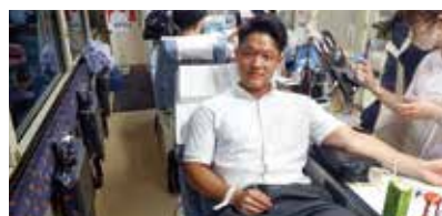
▲しんくみ週間(献血活動)