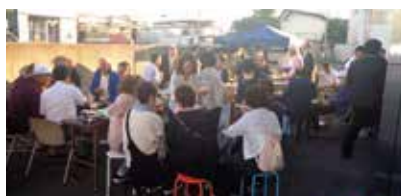
▲苫小牧支店(組合員の集い)