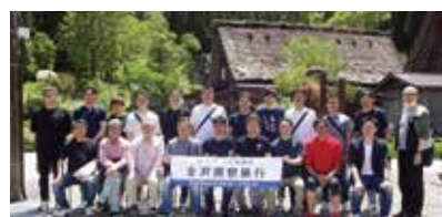
▲ウリ札幌会(金沢視察旅行)