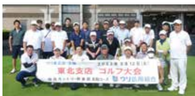
▲ウリ東北会ゴルフ大会