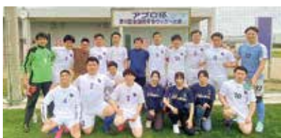
▲青年会アプロ杯サッカー大会