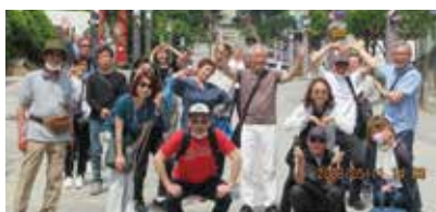
▲ウリ苫小牧会(韓国旅行)