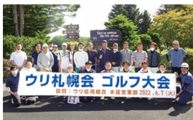
▲ウリ札幌会ゴルフ大会