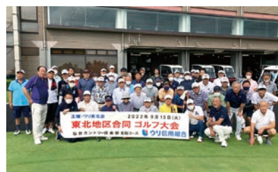
▲東北地区合同ゴルフ大会