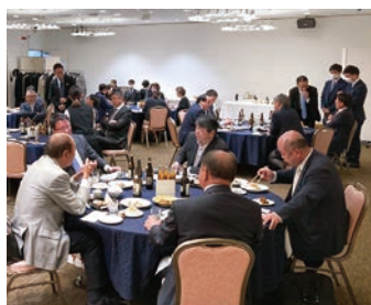
▲ウリ東北会総会(懇親会)