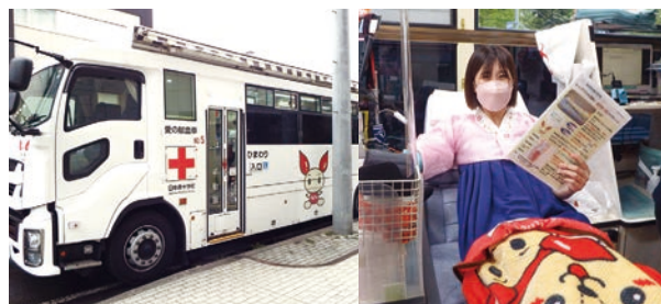
▲しんくみの日(献血活動)