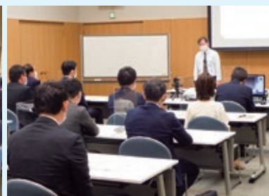
▲課題解決力向上研修