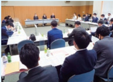
▲融資・渉外担当者会議

各担当者会議では、第58期事業計画の実行性確保に向けた、具体的な討議が行われた。