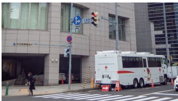
▲献血バス(本店建物前)