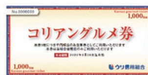
▲当選者に進呈するグルメ券