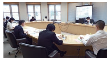
▲担当部門別会議(リモート開催)