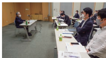
▲外部講師による研修

地域のお客さまの利便性向上を図るため、職員の金融知識やマナー向上、提案力アップに向けた外部研修会の参加や担当部門別会議を定期的開催しております。