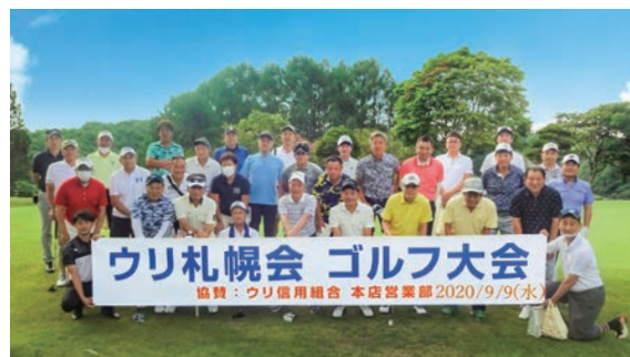
▲ウリ札幌会・ゴルフ大会(朝鮮学校チャリティーコンペ)