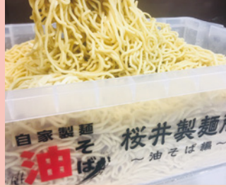
▲製麺されたばかりの生麺