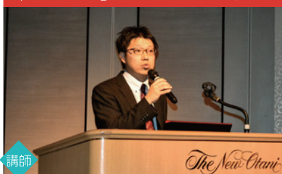
「RESUS」についてのセミナー