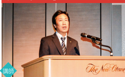
「AIさくらさん」についてのセミナー

11月13日(水)にウリ札幌会を含む3団体共催による経済セミナーをホテルニューオータニ札幌にて開催しました。セミナーは2部編成で行われ、最初に行われた「自己学習型AIによる接客サービス向上」についてのセミナーでは、企業の業務改善が期待される人工知能接客サービス「AIさくらさん」の紹介がありました。引き続き行われた「地域経済分析システムRESUS(リーサス)」についてのセミナーでは、誰でも無料でアクセスできる地域経済分析システム「RESUS」の紹介がありました。セミナーにはウリ後援会会員と青商会の方々を中心に86名が参加し、講演後に懇親会も催されました。