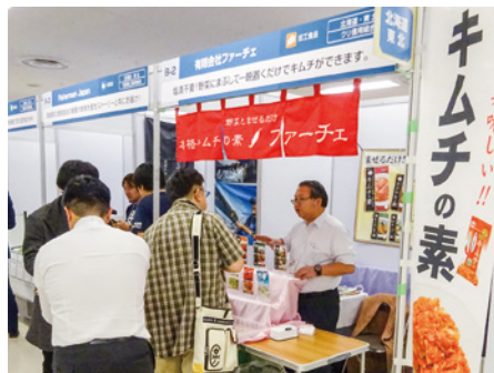
▲(有)ファーチェの出展ブース