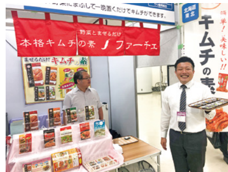
▲当組合職員によるサポート